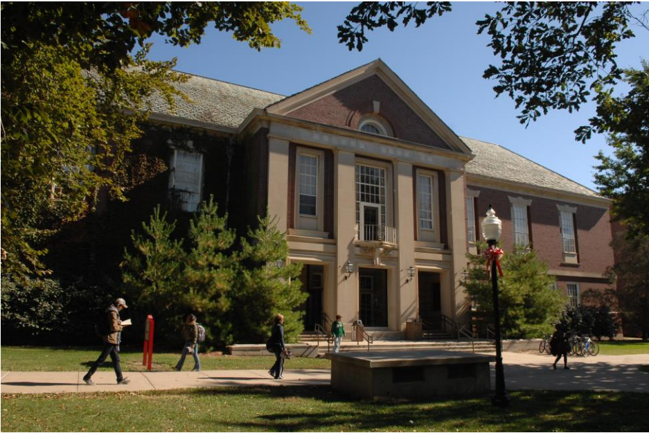
Illinois State University – Williams Hall Lieu de Localisation de Management Development International